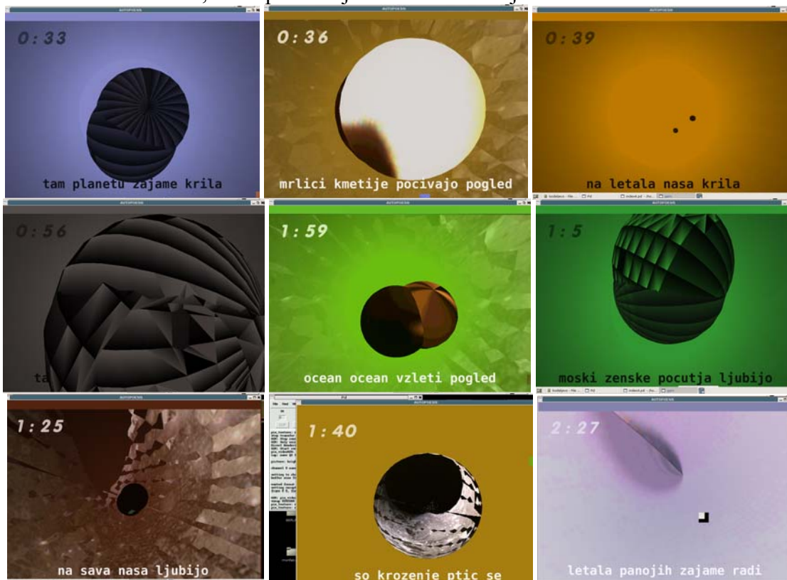
Videografika 6, v okviru zvočnega nastopa na projektu Confine Aperto na gradu Kodeljevo / Ljubljana, junij 2007, avtor pesmi ključnih besed: Boštjan Leskovšek

Za vizualni del je najpomembneje, da deluje na način »mesa« / telesa, torej mora izkazovati zveznost gibanja / spreminjanja – prav tako pa ne sme biti enostavna zanka, ki se sčasoma le ponovi. Na nek način je to naš reprezentant v umetnem okolju. V primeru koncerta je to telo »potujeni« reprezentant, ki opisuje zvok – na nek način naš »plesalec/plesalka«. Do določene mere sinhronost, v večji meri pa avtonomnost.