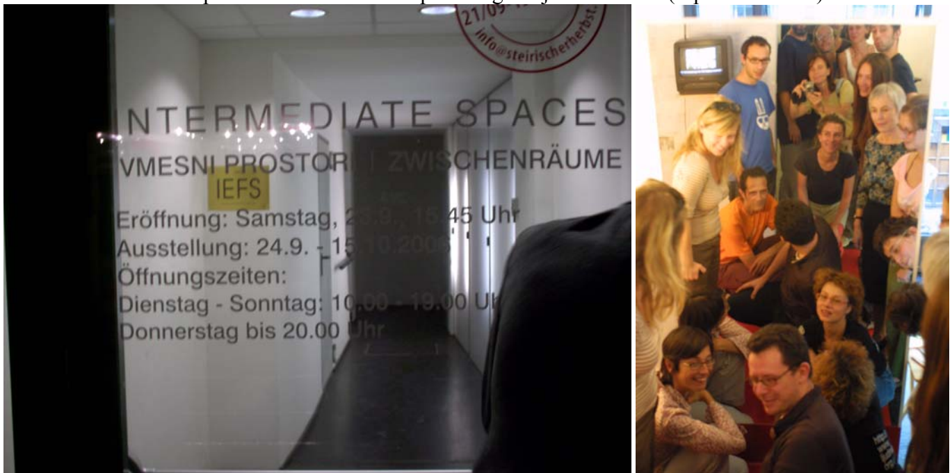
Vmesni prostori / Intermediate Spaces v galeriji ESC / Graz (september 2006)

Gostujoči umetniki so predstavili svojo produkcijo – z obširnimi predstavitvami svojih del. Torej je bil poudarek na performativnih – socialnih in akcijskih praksah. Pri intenziviranju teh produkcij smo si pomagali z zanimivimi lokalnimi udeleženci, ki prav tako ustvarjajo zanimive raziskujoče in samosvoje pristope. Še posebej se podpira mešane kreacije – med umetniki iz Graza in Ljubljane. Vendar to ni nujno – le če so samoiniciativni rezultat obojestranske naklonjenosti.